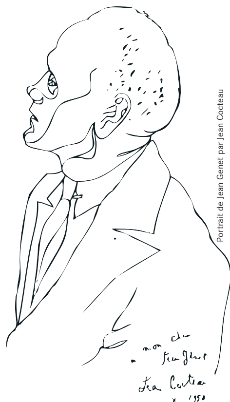
Portrait de Jean Genet par Jean Cocteau

Entrée : 30€ - étudiants : 20€ - Chèque à envoyer à l'ordre de UFORCA Aix-Marseille : la Terrasse, bât C - rue du Clos Cangina - 13100 AIX-EN-PROVENCE